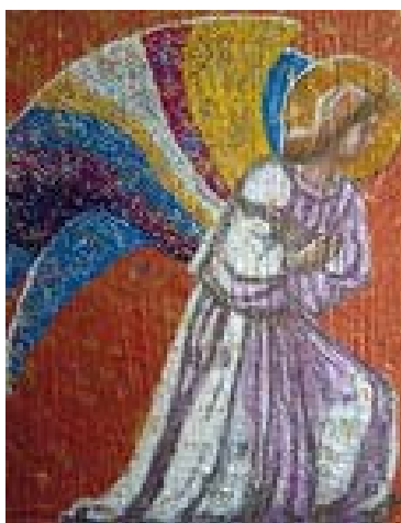
Greetje van den Akker: Kerst

Zij exposeren met schilderijen. De meeste werken zijn ook te koop.